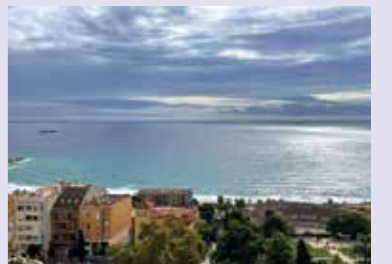
学会の行われたスペイン・タラゴナ

他大学の教員である妻と同じ国際学会で発表の機会があったため、小学生の子ども2人を連れて欧州へ出張しました。両親ともに長期間家を空けることが難しい状況でしたが、本制度のおかげで「家族で行けば大丈夫」と思い切って決断することができました。