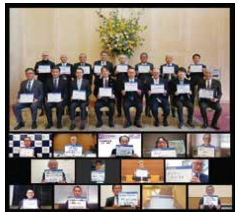
第13回リーダーミーティング

本学では今後も、こうした対話の場への参画を通じて、多様性を尊重する大学づくりと社会への発信を進めていきます。