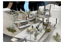
図4 最終成果物の一例